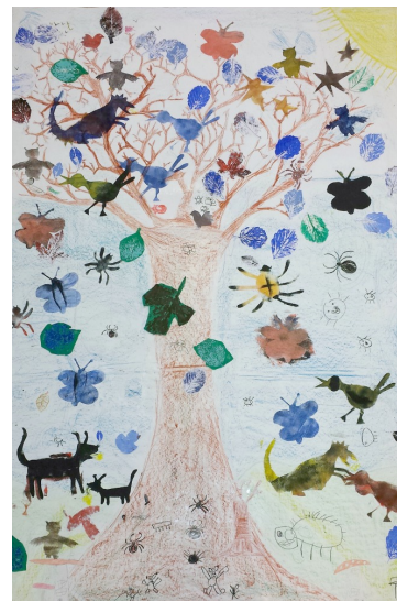
Leerlingen van de Kompasschool werkten het thema herfst en Halloween uit in een gezamenlijk werk.