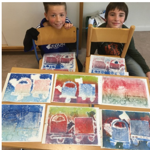
Op De Vliekotter werkten de leerlingen in duo's aan een kalender.

Ze kozen voor bestaande feesten (Carnaval in de afbeelding rechts) en nieuwe feesten (Fruitdag in de afbeelding links)