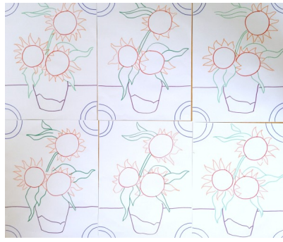
Op De Fontein waren het Van Goghs zonnebloemen