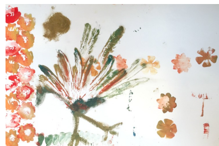
Op de Lubertischool maakten de leerlingen ritmes en lijnen, schilderijlijsten en zelfs een pauw