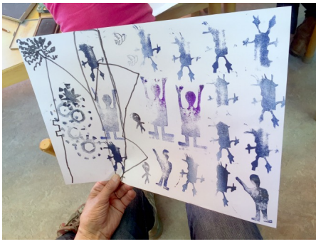
Op De Vliekotter was het thema mensen