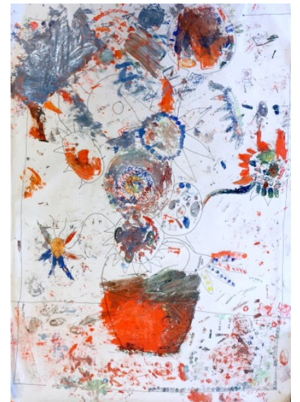
Op de Durperhonk werkten ze ook aan de Zonnebloemen van Van Gogh