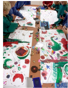
Op De Bruinvis werkten ze op Van Goghs sterrennacht